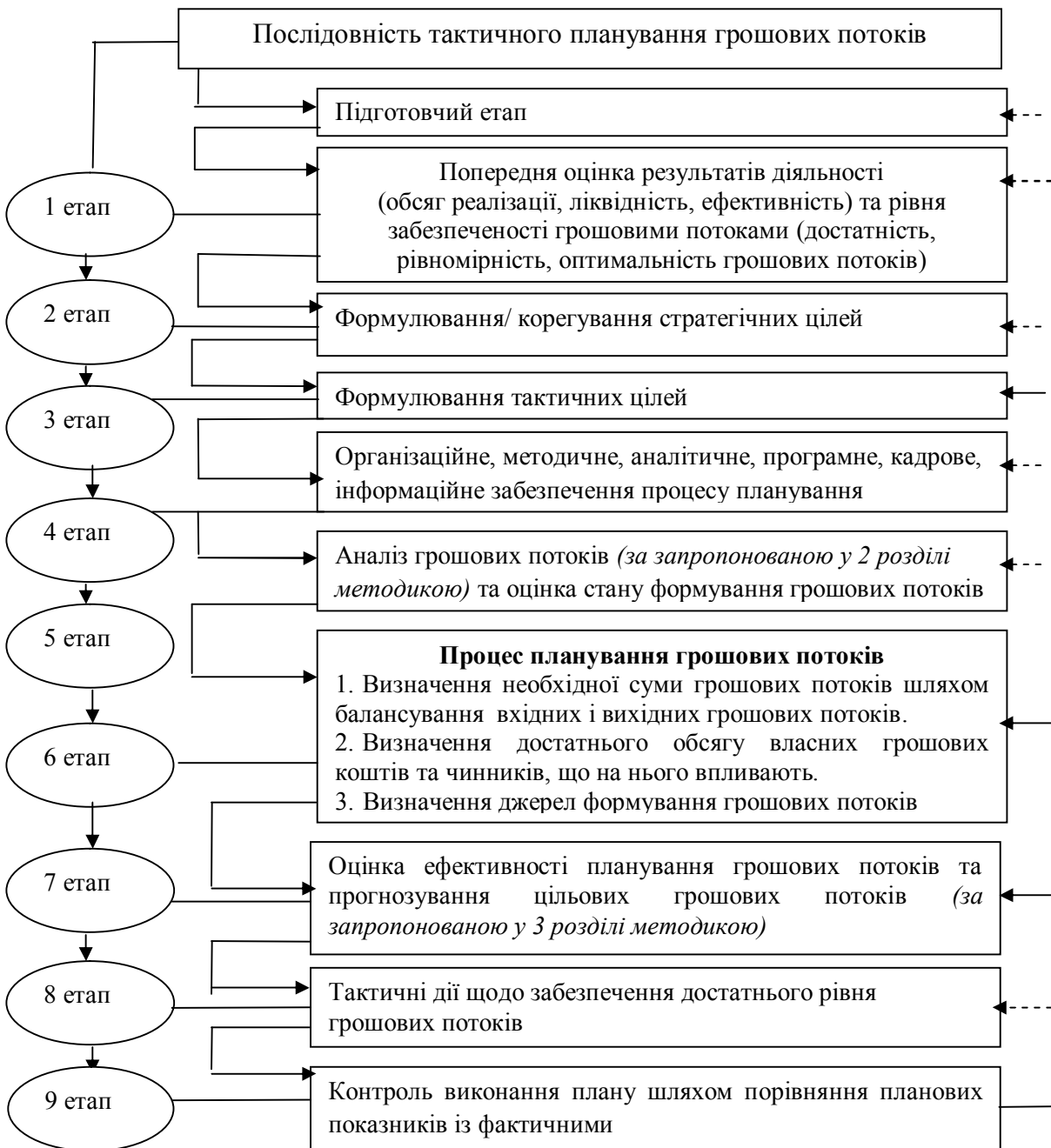
Рис.2. Послідовність тактичного планування грошових потоків

Організацію тактичного планування грошових потоків на підприємствах пропонується здійснювати, використовуючи наведену послідовність (рис. 2), яка дозволяє підвищити ефективність планування грошових потоків і забезпечує вплив процесу тактичного планування на платоспроможність підприємства, швидкість обороту обігового капіталу, обсяги залучених коштів та кредиторську заборгованість, а в кінцевому результаті впливати на рентабельність підприємства та його конкурентну позицію.