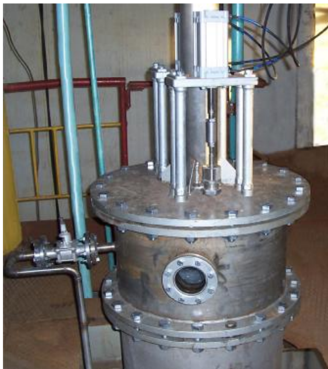
Рис.2. Реалізація механотронної підсистеми для управління процесами масообміну в розгінній колоні

параметрів (температури, тиску) відбувався за допомогою автоматичних датчиків, сигнал з яких передавався на мікропроцесорний контролер.