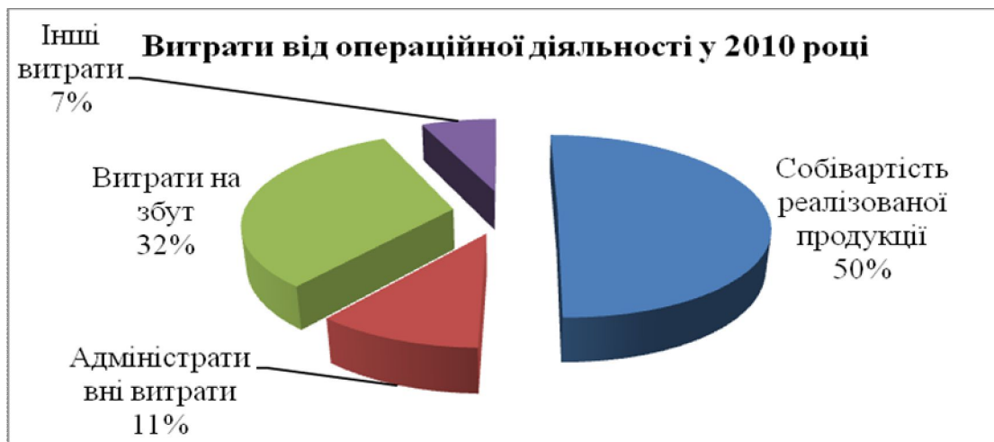
Рис. 2. Питома вага витрати від операційної діяльності у 2010 році