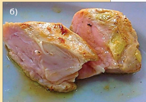
Рис.2. Зовнішній вигляд отриманих напівфабрикатів а) без обсмаження; б) з наступним обсмаженням

можливість ефективного управління собівартості продукту в ринкових умовах.