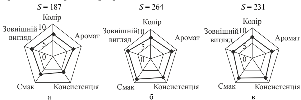
Рис. 3. Профілограми органолептичної оцінки якості зразків киселю: а — ТМ «Мрія» (контроль); б — «Фрутик»; в — «Фруктовий рай»

На рис. 3 представлено профілограми органолептичної оцінки якості досліджуваних зразків киселів. Зразок 3а (ТМ «Мрія», полуничний смак) придбаний у торговельній мережі як контроль. Зразок 3б — кисіль швидкого приготування на основі цукру та фруктових порошоків, як структуроутворювач використаний НК. Зразок 3в містить у своєму складі цукор, фруктовий порошок і монокротмальфосфат.