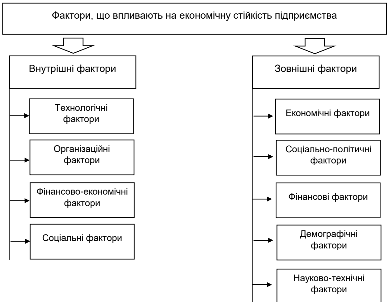
Рис. 1.2. Фактори, що впливають на економічну стійкість підприємства

Якщо внутрішні фактори можуть здійснювати як позитивний, так і негативний прояв на економічну стійкість підприємства, то зовнішні фактори впливають на її формування та підтримку. У випадку їх негативного впливу вони здійснюють значний руйнівний вплив на економічну стійкість підприємства.