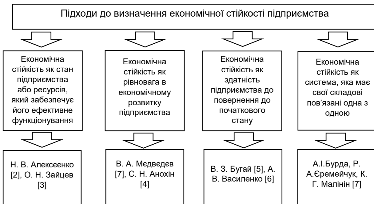
Рис.1.1. Підходи до визначення економічної стійкості підприємства

Аналізуючи різні підходи щодо визначення змісту поняття економічної стійкості буде доцільним виокремити чотири основних. (рис.1.1)