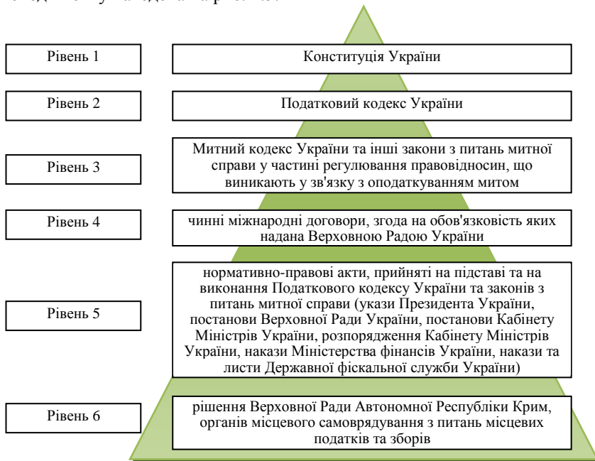
Рис. 1.5. Нормативно-правове забезпечення податкового менеджменту

Модель ієрархічної системи нормативно-правових актів податкового менеджменту наведена на рис. 1.5.