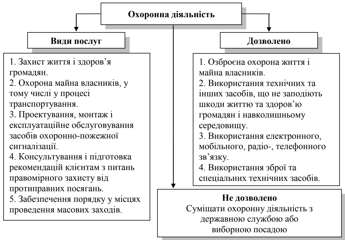
Рис. 2. Повноваження охоронної діяльності підприємства

Особливе становище в структурі СЕБ займає група надзвичайних ситуацій (кризова група). Підприємство і, відповідно служба безпеки, можуть працювати в двох режимах – звичайному і надзвичайному. При звичайному режимі не виникає серйозних загроз економічній безпеці