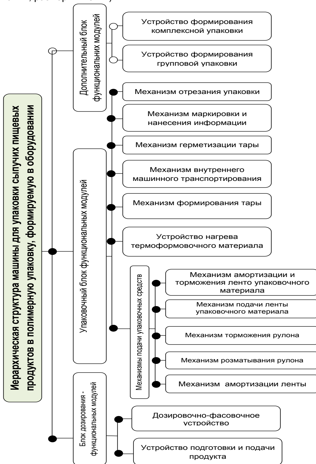
Рис.2. Обобщенная структура машины для упаковки пищевых продуктов в упаковку, формируемая в оборудовании: ● вершины связанные “и”, ○ - вершины связанные “или”

Данные, выбранные в качестве исходных параметров, из технических характеристик оборудования (производительность, масса, мощность, пределы дозирования, размеры пленки).