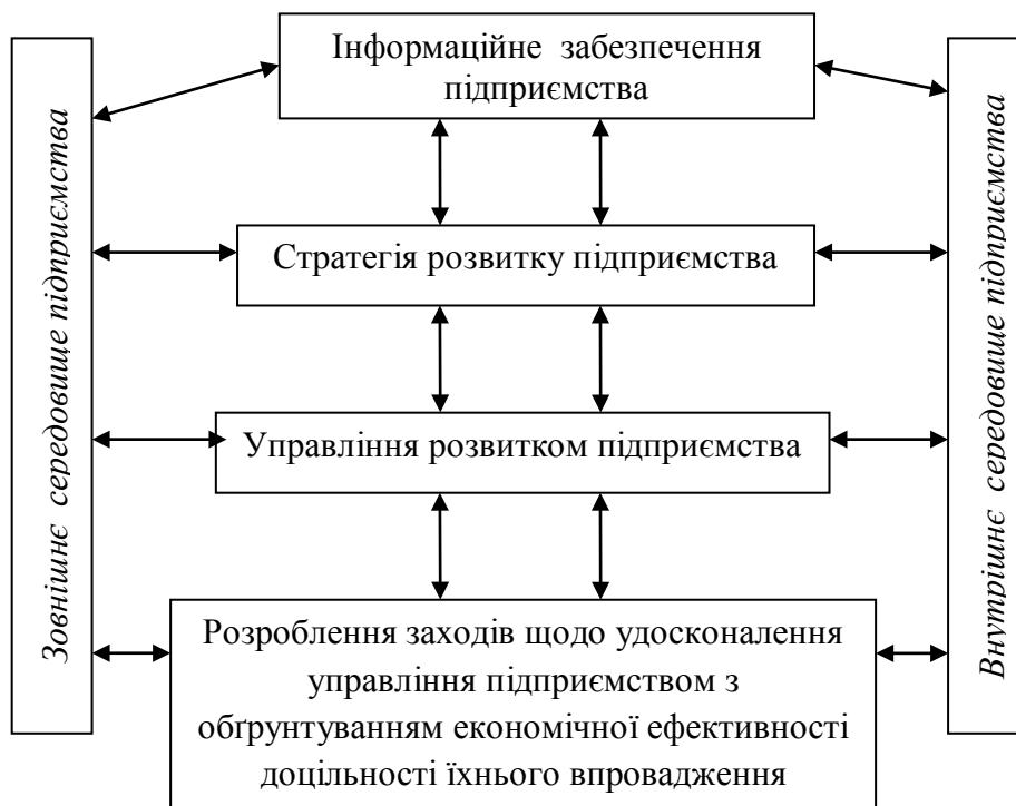
Рис.1. Вплив інформаційного забезпечення на стратегічне управління підприємства

Сучасні стратегічні завдання функціонування підприємств м'ясопереробної галузі: виробництво високоякісної продукції з урахуванням платоспроможності і вимог споживачів для збереження їхнього здоров'я; розроблення нових видів продукції з більш дешевої та доступної сировини; збільшення експорту м'яса та м'ясної продукції; впровадження стандартів; оновлення техніко-технологічної бази та виробничих потужностей тощо.