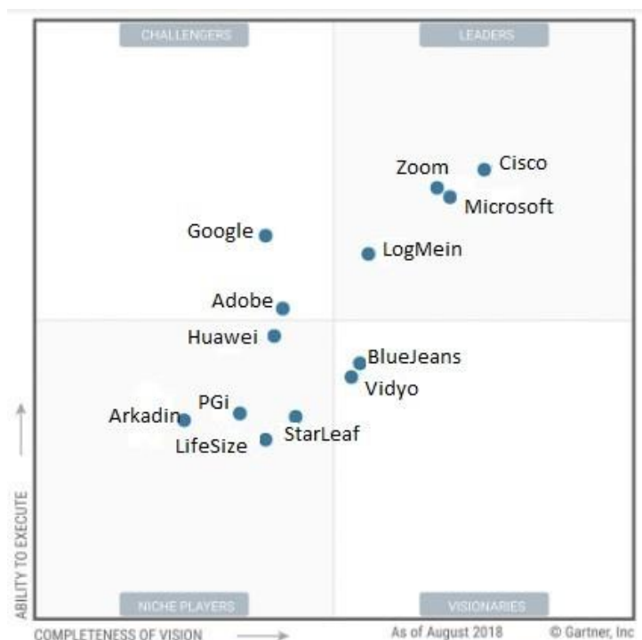
Рис.1 – «Магічний квадрант» Gartner для систем відео-конференцій зв’язку [2]

Зі свого боку дослідницька компанія IDC в липневому дослідженні 2019 року лідерами ринку ВКЗ назвала Cisco і Microsoft (рис.2). Великими гравцями ринку названі Google, Zoom, BlueJeans, Vidyo, Avaya, Lifesize, Huawei і Polycom.