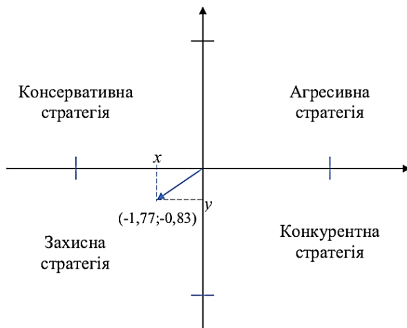
Рис. 2. SPACE-матриця для ПрАТ «Оболонь»

Початок вектора знаходиться в точці початку координат, кінець — в точці з координатами: X = 2,63 - 4,4 = -1,77 ; Y = 2 - 2,83 = -0,83 . Отже, вектор рекомендованої стратегії (рис. 2) побудовано за двома точками: O(0;0) та P(-1,77; -0,83) .