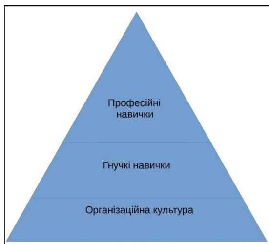
Рис. 1. Середовище формування гнучких навичок

діяльності. Отже, таким чином відбувається процес формування професійних навичок, а моделюючи ситуації, наближені до реального життя, студенти розвивають і власні гнучкі навички. (рис. 1).