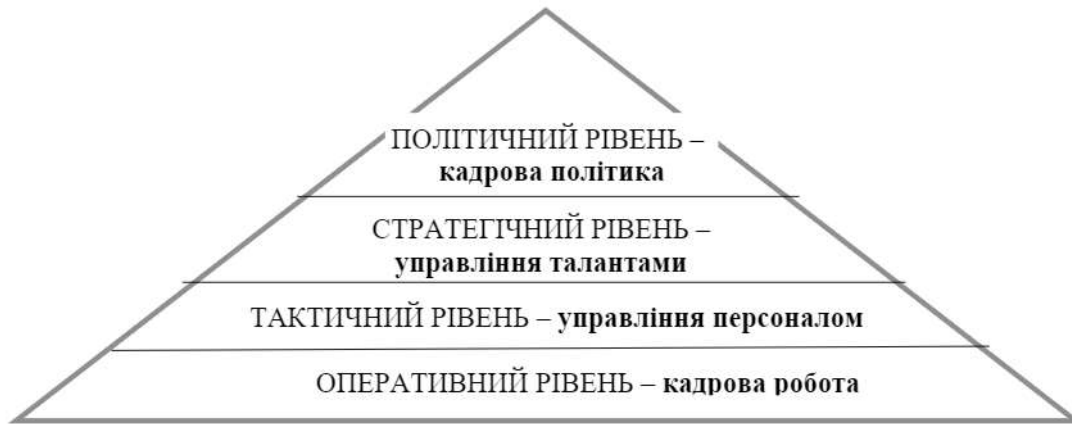
Рис. 1. Уточнення рівнів управління персоналом підприємства

самостійно й оригінально виконати певну складну діяльність. Така сукупність здібностей дає змогу одержати інтелектуальний продукт діяльності, який вирізняється новизною, високим рівнем досконалості.