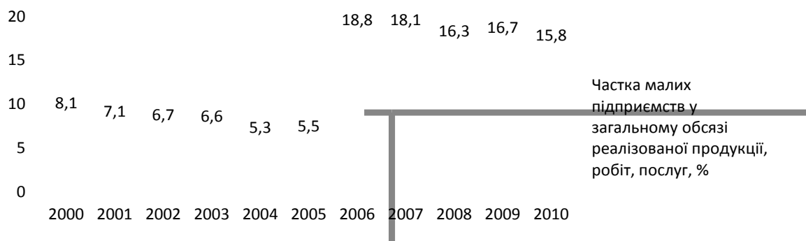
Рис. 1 Частка малих підприємств в загальному обсязі реалізованої продукції, робіт, послуг у 2000-2010 роках, % [5].

Із 2005 року, наприклад, розвиток малого підприємництва характеризувався, як позитивними, так і негативними тенденціями. Протягом 2005-2009 рр. значно зросла кількість малих підприємств у розрахунку на 10 тис. осіб наявного населення – із 63 до 75 осіб, збільшилась частка малих підприємств у загальному обсязі реалізованої продукції, робіт і послуг із 5,5% до 16,6%, тобто у три рази. Однак, починаючи із 2010 року, частка малих підприємств у загальному обсязі реалізованої продукції, робіт, послуг стрімко зменшилась більш ніж на 1 в.п. порівняно із 2009 роком (рис. 1).