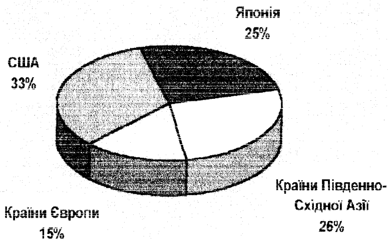
Рис.3. Світове споживання ювелірних виробів з діамантами

Світовий ринок споживання ювелірних виробів з діамантами значно збільшився за останні десятиріччя. За оцінками експертів, світовий обсяг їх продажу за останнє десятиріччя зріс удвічі й досяг у 1994 році $43 млрд. Найбільшими споживачами ювелірних виробів з діамантами сьогодні є США -33 %, країни Південно - Східної Азії - 26 %, Японії - 25%, країни Європи - 15%.(рис.3)