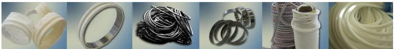
Рисунок 3.1 – Стопорні кільця Snap ring, кільця з пружинного дроту O-Ring, плетені та каучукові джгути і шнури, використовувані для армування рукавного фільтру 29

Конфігурація рукавів досить проста: це дві частини (верхня і нижня). Нижня буває відкритою або закритою (із вшитим дном або без дна взагалі). Верхня – відкрита і найчастіше містить фіксувальні елементи: металеві пружини, металеві ж закріплювальні кільця, інші елементи ущільнення (рис. 3.1).