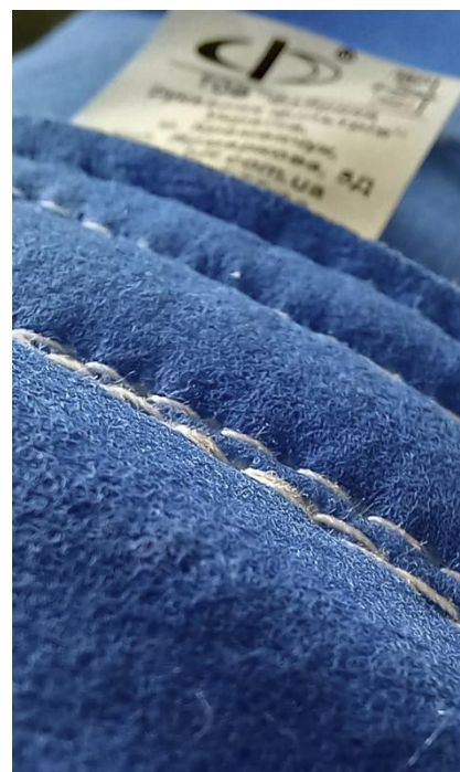
Рисунок 3.2 – Фільтрувальний антиабразивний поліефір на ТОВ «Фабрика рукавних фільтрів»

Способи регенерації (очищення) фільтрувальних рукавів: 28