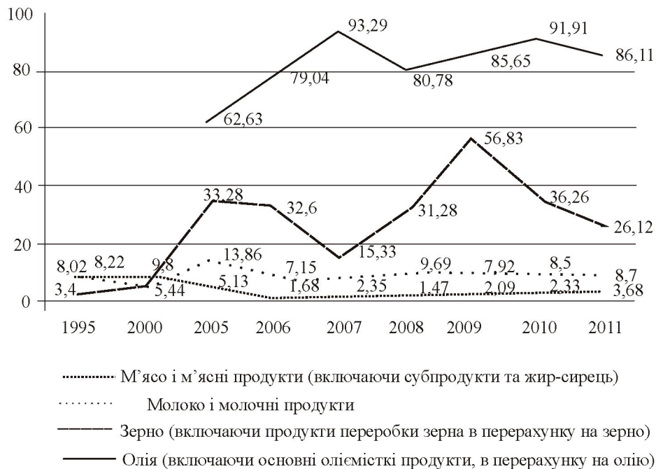
Рис. 1. Експортна орієнтація виробництва основних видів продукції сільського господарства в Україні [7]

Зростання світових цін на імпортовані харчові продукти і сільськогосподарську сировину спричиняє зниження життєвого рівня населення. Крім того, відбувається і непрямий вплив у випадку, коли за кордоном закуповується продукція, що проходить подальшу обробку й переробку в Україні, як, наприклад, какао-боби, різні прянощі, горіхи, рис, риба тощо.