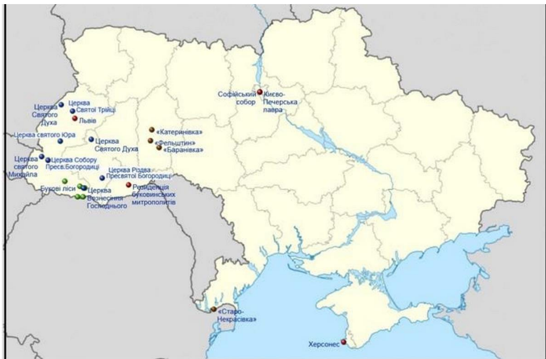
Рис.1.2. Усі об'єкти світової спадщини ЮНЕСКО в Україні

Між тим, включення пам'яток до цього списку не тільки забезпечує їм особливий правовий статус, а й ідентифікує саму територію в потоках глобального туризму, сприяє залученню інвестицій в туристичну сферу. Спеціальні дослідження з проблем історико-культурної спадщини України свідчать про те, що її потенціал залучається до туристичної галузі безсистемно, а пізнавальна функція цього ресурсу зводиться до мінімуму [20].