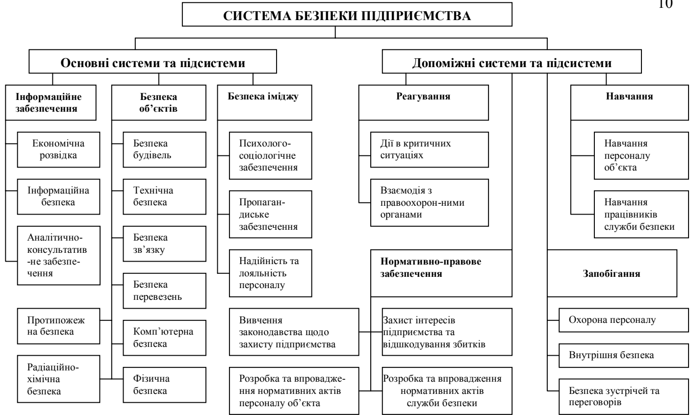
Рис. 2. Система безпеки підприємства [розроблено автором]