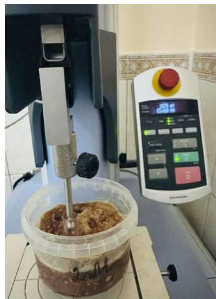
Рис. 1. Текстурометр Shimadzu EZ-LX (Японія)

Показники твердості до термооброблення м'ясних і м'ясомістких систем з вмістом у зразках 1,5%, 3% та 4,5% суміші харчових волокон представлені на рисунку 2. Твердість зразків з використанням м'ясної сировини була значно вищою порівняно зі зразками з текстуратом соєвого білка та ізолятом соєвого білка.