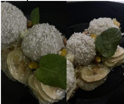
Рисунок 1 – Сорбет «Кокосові обійми з освіжаючим акордом»

Оформлення та профілограма дегустаційного оцінювання авторського сорбету наведено на рис. 1-2.