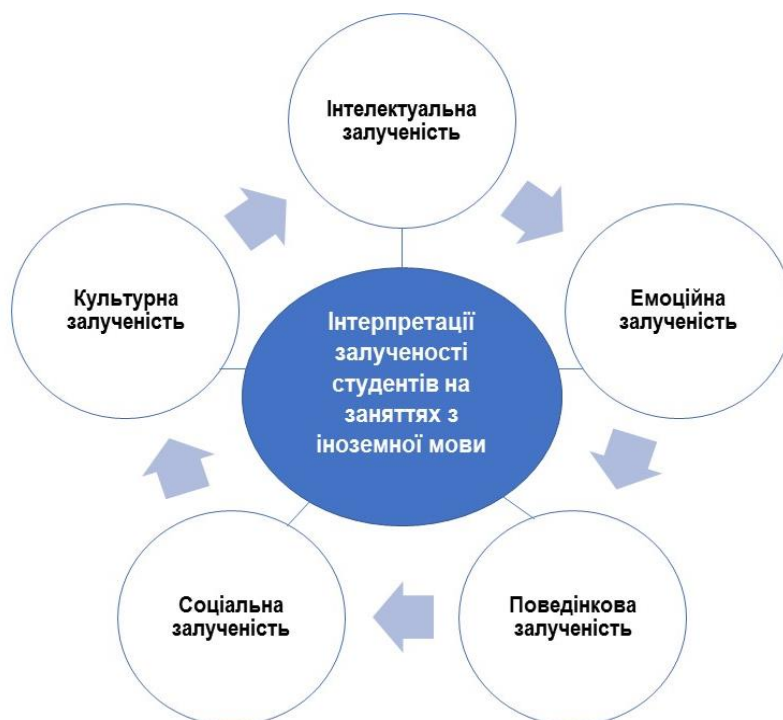
Рис. 2. Інтерпретації залученості студентів на заняттях з іноземної мови

розпитувати їх про академічні та неакадемічні питання, даючи поради та цікавившись позаурочним життям, особистими вподобаннями, майбутніми прагненнями, а також чіткими проблемами та потребами в навчанні.