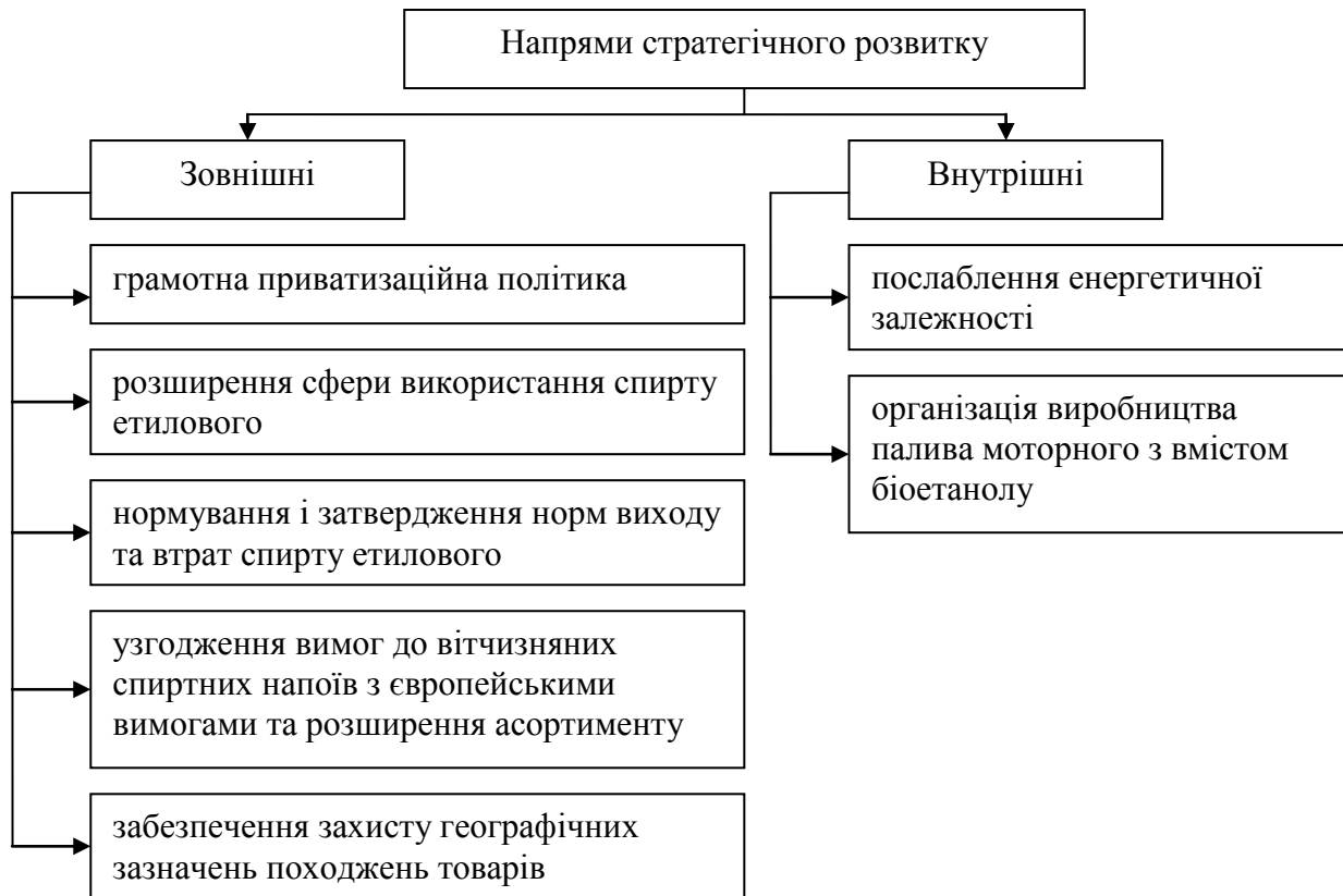
Рис. 1. Напрями стратегічного розвитку підприємств спиртової галузі

Узагальнивши вищезазначені напрями стратегічного розвитку спиртової галузі, їх можна умовно поділити на дві групи: зовнішні – для реалізації яких бракує законодавчого або нормативного регулятора; внутрішні, для реалізації яких бракує організаційного або фінансового регулятора (рис. 2).