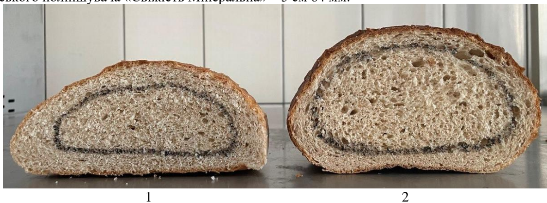
Рисунок 3 – Утворення підскоринкового шару в процесі зберігання хлібобулочних виробів після 72 год зберігання: 1 – контроль; 2 – з комплексним хлібопекарським поліпшувачем «Свіжість Мінеральна»

Результати досліджень свідчать (рис. 3), що у процесі зберігання за умови використання комплексного хлібопекарського поліпшувача «Свіжість Мінеральна» підскоринковий шар через 72 год зберігання менший, порівняно з підскоринковим шаром контрольного виробу. Так, товщина підскоринкового шару у середньому вимірі становить контролю у контролю 9 см 48 мм у разі використання комплексного хлібопекарського поліпшувача «Свіжість Мінеральна» – 5 см 64 мм.