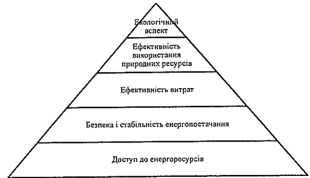
Рис. 1. Піраміда потреб енергетичної політики за К. Фраєм [9]

Без сумніву, пріоритет віддається доступу та стабільності в забезпеченні енергією населення та