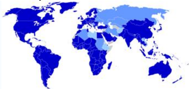
Рис. 1. Країни-члени СОТ, станом на грудень 2005 року

Сьогодні учасниками СОТ є сто п'ятдесят країн світу (рис. 1), близько тридцяти країн ведуть переговори щодо вступу до СОТ. Окрім цього СОТ об'єднує понад 95% обсягу світової торгівлі, близько 85% світового ВВП та понад 85% населення світу. [1]