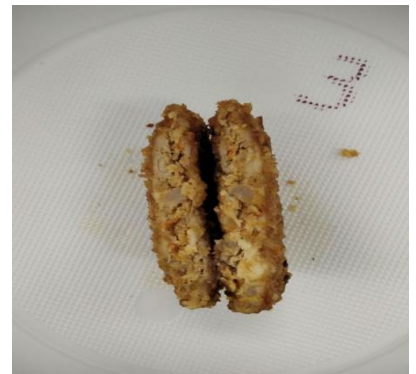
Рис.3.3.9. Зразок №3 після смаження

Щоб більш наглядно продемонструвати загальну картину порівняльної сенсорної оцінки та якісні відмінності досліджуваних зразків органолептичну оцінку доцільно доповнити побудовою профілограм.