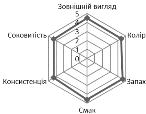
Профілограма органолептичних показників дослідного зразка №2