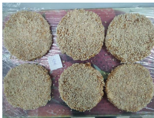
Рис.3.3.2. Зовнішній вигляд котлет вироблених за рецептурою № 2