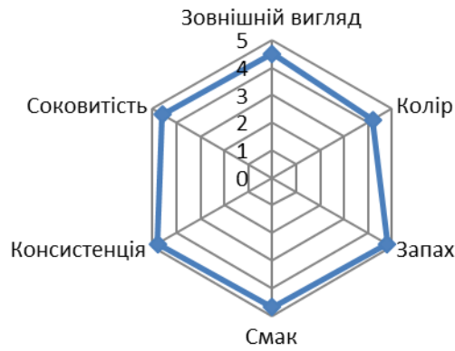
Профілограма органолептичних показників дослідного зразка №1