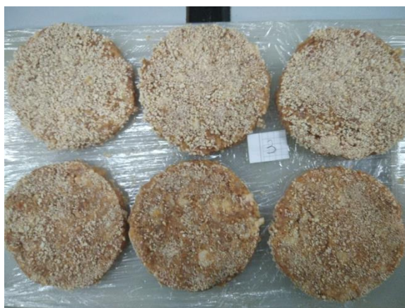
Рис.3.3.3 Зовнішній вигляд котлет вироблених за рецептурою № 3

Органолептичні показники у дослідних зразках оцінювали профільним методом з використанням 5-ти бальної шкали і графічно виразили у вигляді профілограм.