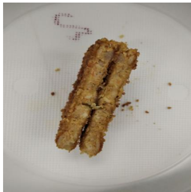
Рис.3.3.8 Зразок №2 після смаження