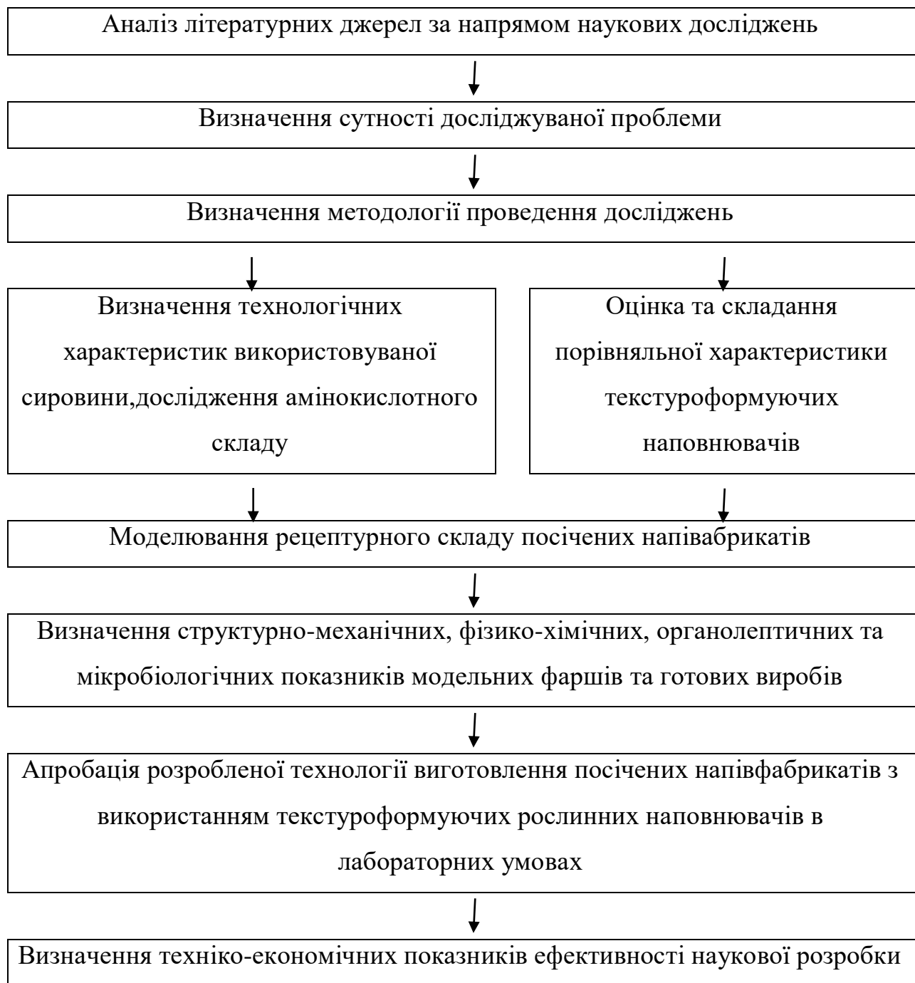
Рис. 2.1. Схема проведення досліджень

Програма досліджень відображає послідовність проведення експериментальних досліджень та взаємозв'язок між показниками та обраними методами для їх визначення.