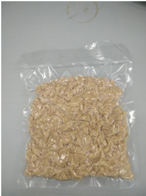
Рис. 3.3.5. Наповнювач гороховий T65M