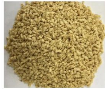
Рис. 3.5 Соєвий Extruded 9403