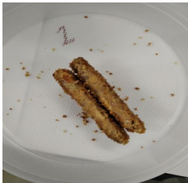
Рис.3.3.7. Зразок №1 після смаження

Фото смажених виробів зображено на рисунках 3.5-3.7: