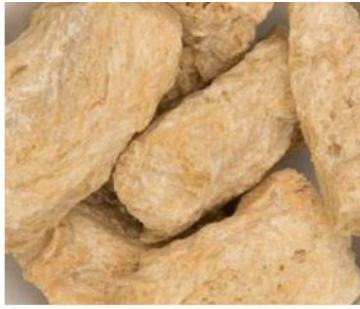
Рис.3.4 Соєвий Supro Max