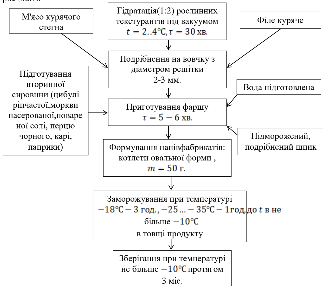
Рис. 3. 2. 1. Технологічна схема виготовлення напівфабрикатів.

Технологічну схему виготовлення посічених напівфабрикатів з використанням текстуроформуєчих рослинних наповнювачів представлено на рис 3.2.1.: