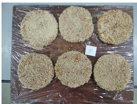
Рис.3.3.1 Зовнішній вигляд котлет вироблених за рецептурою № 1

Зовнішній вигляд формованих виробів до термічної обробки наведено на рисунках 3.1-3.3: