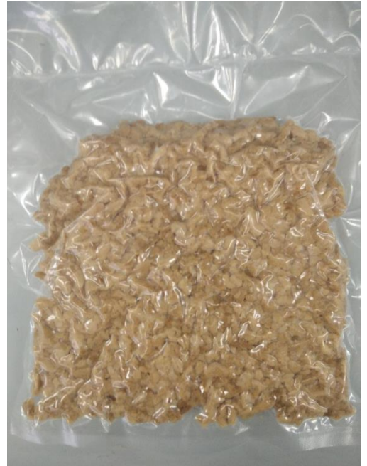
Рис. 3.3.6 Наповнювач соєвий Extruded Soya9403

Фото смажених виробів зображено на рисунках 3.5-3.7: