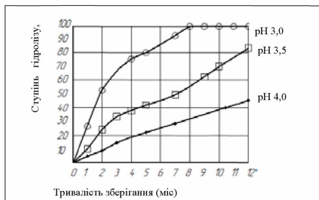
Рис. 2. Гідроліз олігофруктози під час зберігання протягом 12 місяців при температурі 20°C і різних значеннях рН