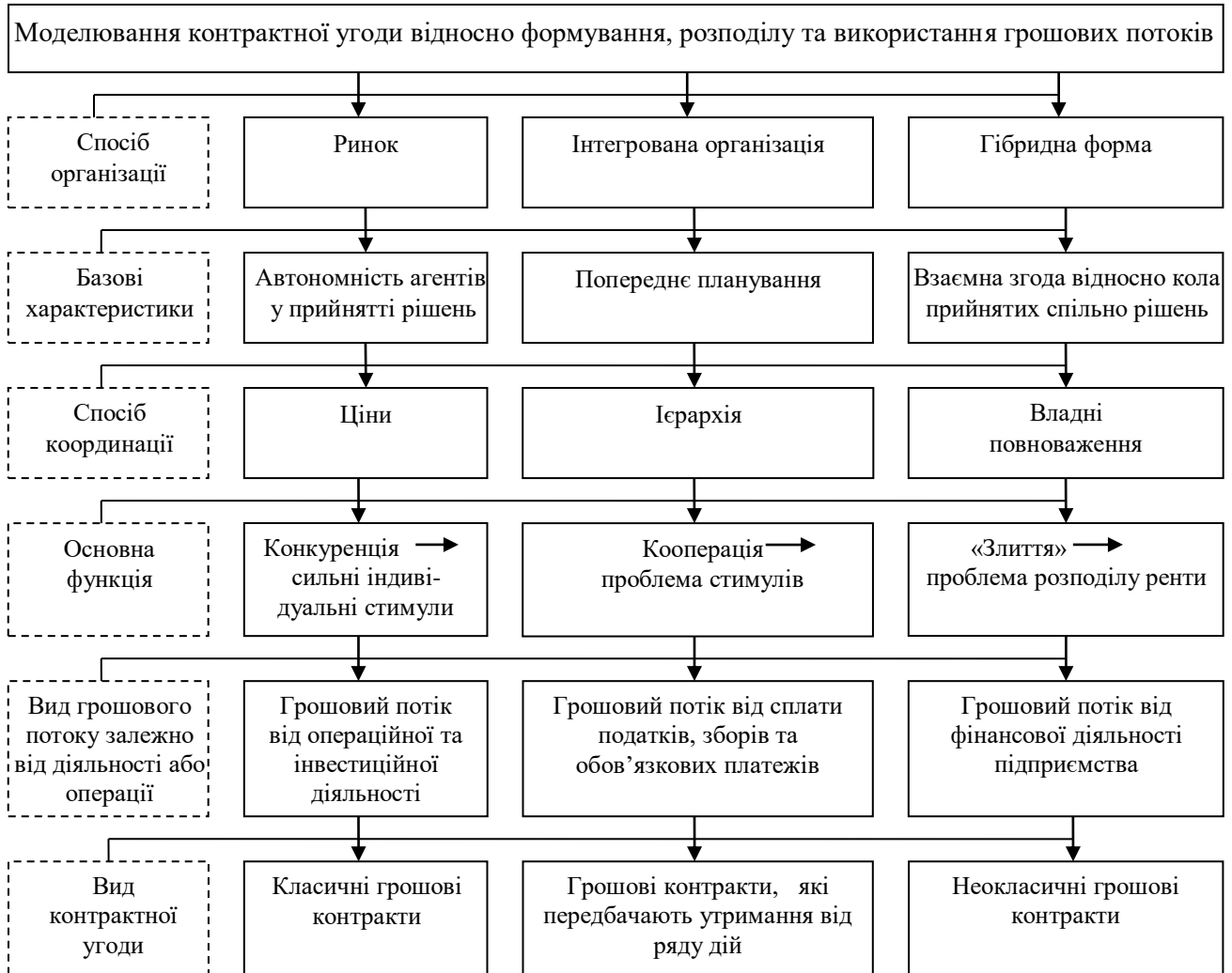
Рис.1 - Відповідність видів контрактних угод способам організації та їх характеристикам

Із припущенням «прораховування» економічними агентами своїх рішень розглянута модель означає, що під впливом конкуренції агенти постійно шукають найбільш адекватну структуру, тобто структуру, яка відповідає атрибутам трансакції і тому сприяє зведенню трансакційних витрат до мінімуму. Тобто, обрана в конкурентному середовищі структура мінімізує трансакційні витрати.