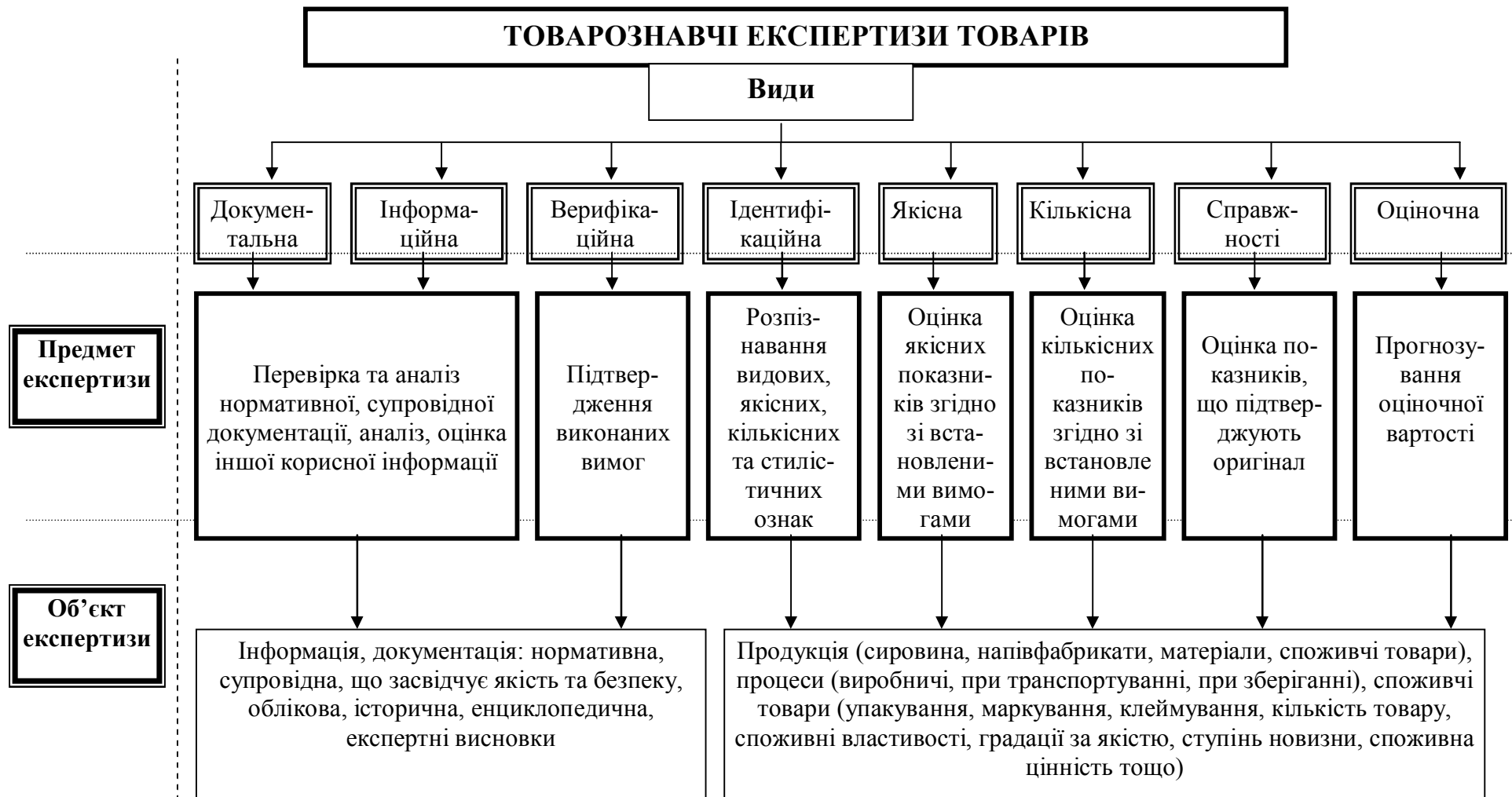
Рис. 1.2. Критерії розподілу експертиз товарів