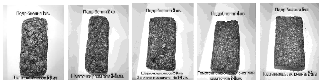
Рис. 2. Зразки батончиків при різній тривалості подрібнення

З метою отримання фруктового батончика з високими споживчими показниками було проведено дослідження впливу тривалості подрібнення фруктової маси, в складі якої переважали висушені яблука, на її структурно-механічні та органолептичні показники. Для подрібнення маси було використано кухонний блендер-подрібнювач потужністю 700 Вт. Для проведення дослідження всі компоненти завантажувались одночасно до камери подрібнення і подрібнювались на максимальній потужності. Результати лабораторних досліджень впливу тривалості подрібнення фруктової маси на її консистенцію та органолептичні властивості представлені на рис. 2.