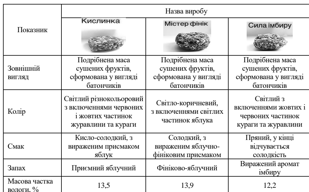
Таблиця 6. Органолептичні та фізико-хімічні показники готових виробів на основі фруктової сировини

Для розроблених зразків був проведений розрахунок комплексного показника якості з оцінкою одиничних органолептичних показників виробу, результати якого демонструють, що розроблені батончики за розрахунками комплексного показника якості отримали оцінку «відмінно» (табл. 7).