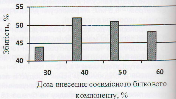
Рис. 1. Зміна показника збитості дослідних зразків морозива

Для молочної основи з фруктозою використовують: молоко натуральне, сухе молоко, масло вершкове або згущене молоко з фруктозою, фруктозу, інтегровану стабілізаційну систему, питну воду. Приготування молочної основи, що містить фруктозу, здійснюється за загальноприйнятною у виробництві морозива технологічною схемою.