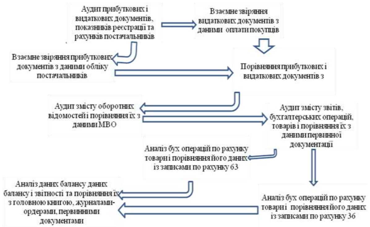
Рис. 3.2 Схема послідовності проведення аудиту товарів

Аудит товарів розпочинається з проведення інвентаризації підприємством роздрібною торгівлі на момент початку аудиту. Це надасть можливість аудитору співставити результати, здійснити можливість перевірки системи внутрішнього контролю, та підтвердити реальні залишки товарів на момент перевірки. Так як асортимент товарів є значний, аудитор може проводити перевірку вибірково, але при цьому оцінює ризики, а якщо аудит проводиться не вперше оцінює попередній аудиторський ризик [6].