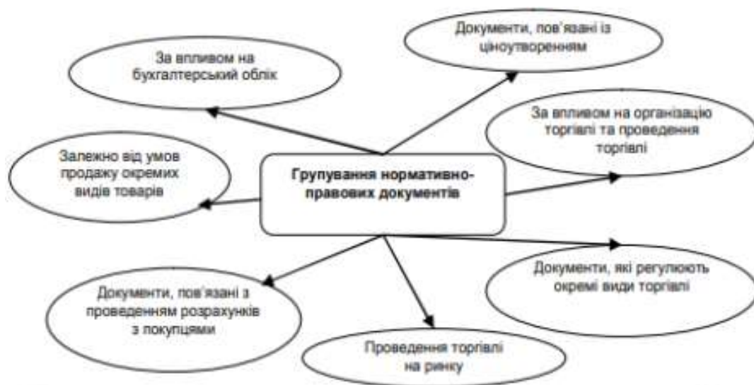
Рис 1.1. Групування нормативно-правових документів, які стосуються торговельної діяльності

торговельної діяльності на різні сфери, що і обумовлено створенням розширеної основи її законодавчого регулювання. Так, їх можна поділити на ті, які прямо впливають на бухгалтерський облік відображення операцій з товарами в торгівлі, і нормативно-правові документи, які стосуються організації та ведення торговельної діяльності в загальному, а також безпосередньо нормативні документи, які регулюють діяльність окремих видів торгівлі (рис.1. 2).