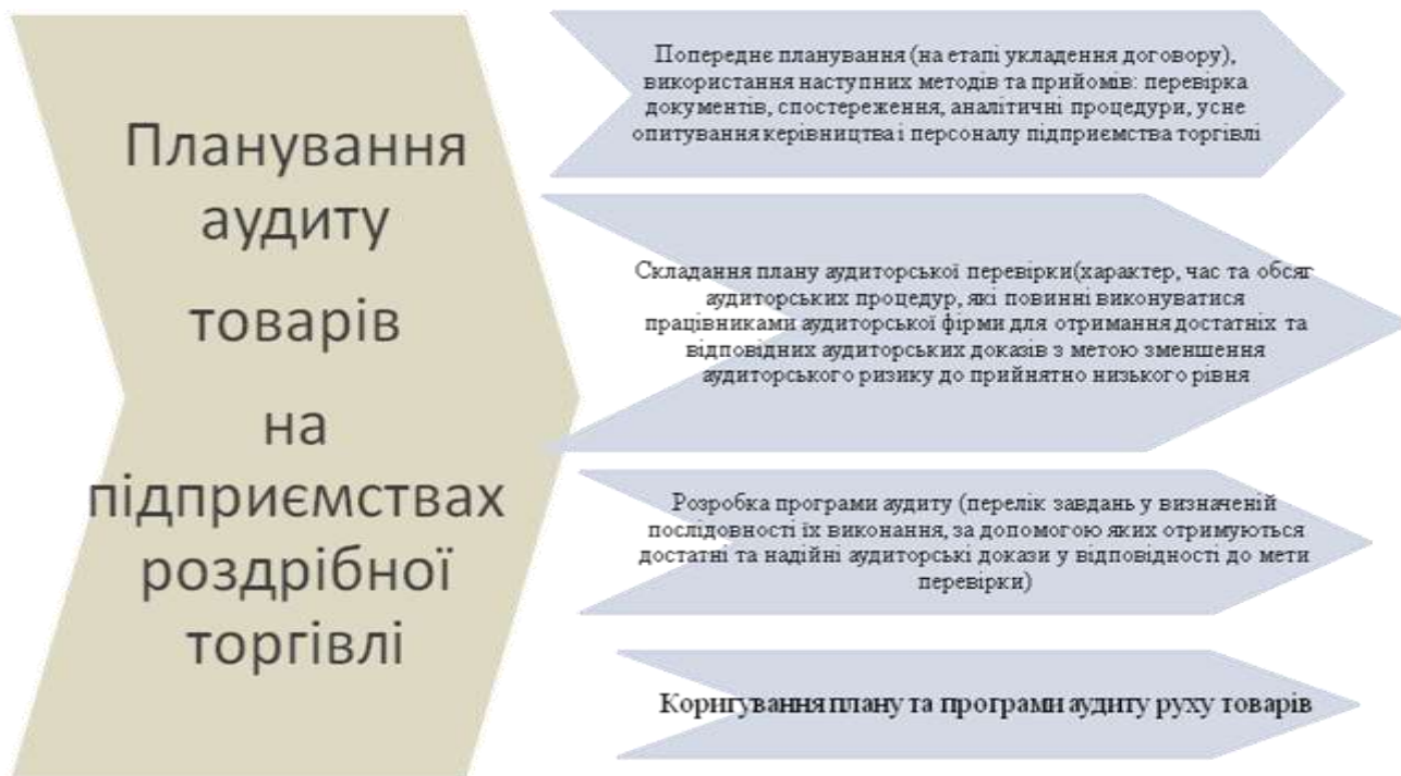
Рис. 3.1. Складові планування аудиту товарів на підприємствах роздрібно торгівлі

При оцінюванні аудиторського ризику зазвичай застосовуються три основні градації: високий; середній; низький, аудиторський ризик завжди знаходиться в межах між 0 і 1 (або від 0 до 100%). "Високий" – аналітичні процедури; "середній" – аналітичні процедури та тести ефективності процедур внутрішнього контролю; "низький" – аналітичні процедури, тести ефективності процедур внутрішнього контролю та процедури по суті (детальні тести) – вибіркова перевірка не менше двадцяти відсотків.