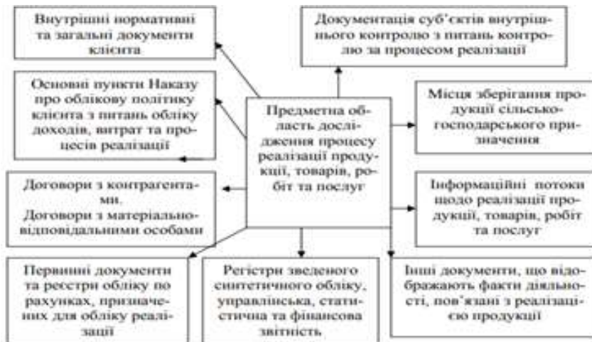
Рис. 3.3. Джерела інформації для аудиту реалізації товарів

Основними завданнями аудиту товарів є встановлення правильності: - відображення в обліку фактичної виручки від реалізації товарів; - відображення в обліку фактичних витрат на товари; - визначення сум податкового доходу від реалізації товарів та підтвердження сум податкових витрат, для достовірної суми визнання бази оподаткування податком на прибуток та ПДВ [5]. Розкриття основних завдань аудиту операції з обліку товарів, представлено на рис. 3.4