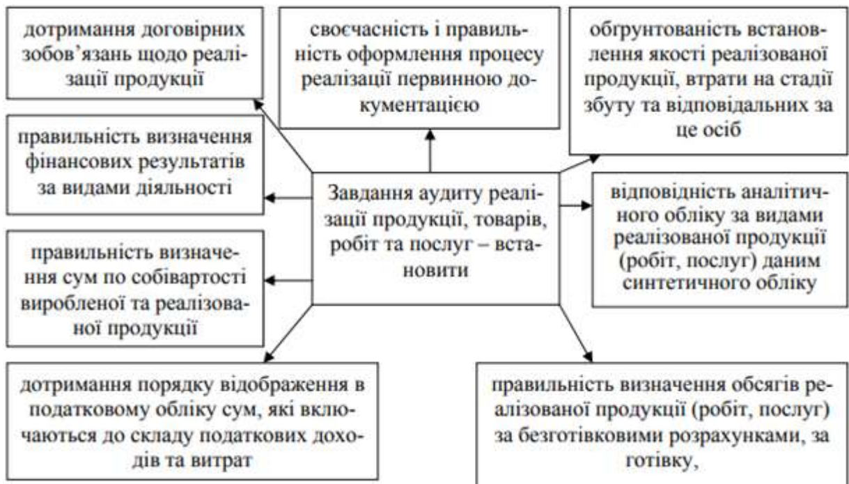
Рис. 3.4 Завдання аудиту реалізації продукції (товарів, робіт та послуг)

Основними завданнями аудиту товарів є встановлення правильності: - відображення в обліку фактичної виручки від реалізації товарів; - відображення в обліку фактичних витрат на товари; - визначення сум податкового доходу від реалізації товарів та підтвердження сум податкових витрат, для достовірної суми визнання бази оподаткування податком на прибуток та ПДВ [5]. Розкриття основних завдань аудиту операції з обліку товарів, представлено на рис. 3.4