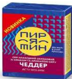
Рис. 2.1. Торгова марка Пирятинь

Пирятинський сирзавод відіграє ключову роль у визначенні тенденцій розвитку сирної галузі в Україні. Їхні ініціативи та новаторські підходи стають прикладом для інших виробників у сфері. Це сприяє не лише підвищенню якості продукції в цілому, але й розвитку сектору молочної промисловості в країні.