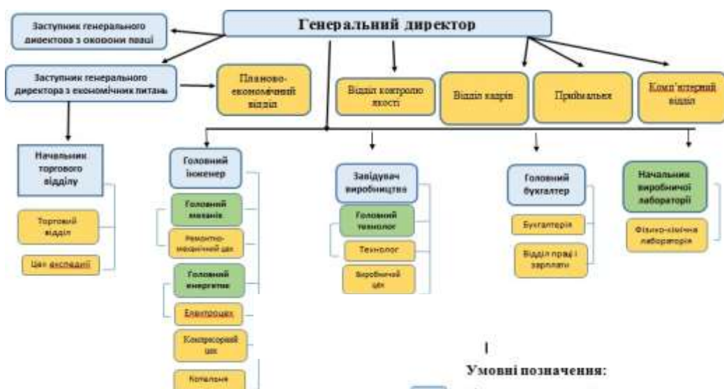
Рис. 2.2. Організаційна структура ТОВ «Пирятинський сирзавод»

На ТОВ "Пирятинський сирзавод" спрямовано виробництво різноманітної молочної продукції, від твердих та плавлених сирів до продукції з незбираного молока та сухої молочної сироватки. Це вимагає добре налагодженої організаційної структури для координації всіх аспектів виробництва, якості продукції та її постачання на ринок. Успіх підприємства базується на трьох основних компонентах: традиціях та досвіді, майстерності персоналу та сучасному технологічному обладнанні. Ці фактори допомагають забезпечити високу якість продукції та задоволення потреб споживачів. Структура управління ТОВ "Пирятинський сирзавод" може бути представлена у вигляді організаційної схеми, яка відображає взаємозв'язок між різними відділами та підрозділами. Керівництво підприємством може здійснюватися через встановлені ланцюги командування та контролю. Зміни в організаційній структурі можуть бути важливими для адаптації до змін у внутрішньому чи зовнішньому середовищі, але водночас можуть бути й ризикованими, оскільки вони можуть вплинути на ефективність та стабільність діяльності підприємства. Організаційна структура ТОВ «Пирятинський сирзавод» представлена на рис. 2.2.