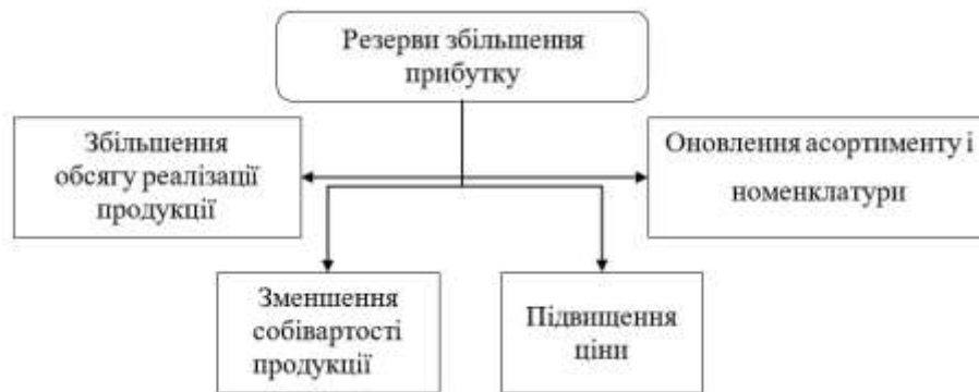
Рис. 3.2. Основні резерви збільшення прибутку вітчизняних підприємств

– Оновлення асортименту і номенклатури продукції дозволяє підприємству відповідати на змінні потреби ринку та привертати нових клієнтів.