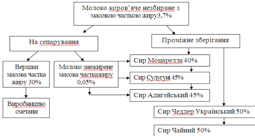
Рис. 2.3. Схема технологічного напрямку переробки молока в цеху ТОВ «Пирятинський сирзавод»

Надходження молока від населення складає значну частину загального обсягу поставок, а саме 60%. Це свідчить про активну участь місцевого населення у сприянні виробництву молочної продукції. Решта 40% поставок молока надходить від фермерських та колективних господарств області, що також є важливим джерелом сировини для ТОВ "Пирятинський сирзавод".