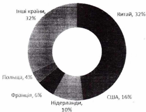
Рисунок 1 – Структура світового виробництва грибів

У зв'язку з цим зростає роль продуктів із природної рослинної сировини, зокрема культивованих грибів [1]. Згідно зі статистичними даними, світове виробництво культивованих грибів становить близько 5 млн тонн на рік і протягом останніх 20 років щорічно збільшується на 13-18%. Вирощуванням їстівних грибів у промислових масштабах займається близько 80 країн світу, що відображено на рисунку 1. При цьому найбільший обсяг виробництва (близько 70%) припадає на печерицю двоспорову ( Agaricus bisporus ), шиїтаке ( Lentinula edodes ) і гливу звичайну ( Pleurotus ostreatus ).