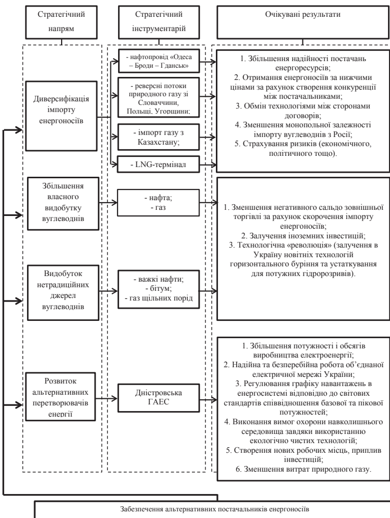
Рис. 3. Диверсифікація джерел постачання енергоносіїв України