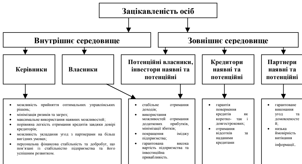
Рис. 1. Зацікавленість осіб у формуванні системи економічної безпеки на підприємстві

Пропонується наступна послідовність створення системи економічної безпеки для підприємств харчової промисловості: визначення особливостей формування системи економічної безпеки для підприємств харчової промисловості; побудова моделі економічної безпеки підприємства; побудова ефективної моделі інформаційного забезпечення діяльності підприємства.