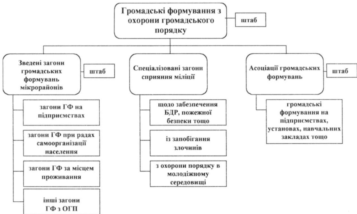
Схема 1 Структура громадських формувань з охорони громадського порядку (витяг із Закону України “Про участь громадян в ОГП і держкордону” від 20.06.2000р.)