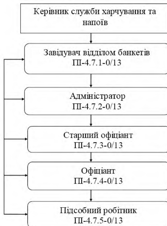
Рисунок 1 – Структура управління відділом банкетів

Особливість організації роботи ресторану - це високий клас обслуговування відвідувачів. Класність передбачає сукупність відмінних ознак підприємства, що характеризують якість надаваних послуг, рівень та умови обслуговування.