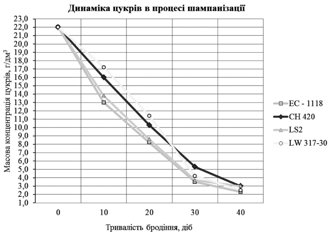
Рис. 2. Графік динаміки цукрів в процесі шампанізації

нення в обробленому купажі крупнокристалічного цукру-піску, фільтрують і витримують 10 дб. Тиражний лікер задається з розрахунку вмісту цукру в суміші 2,2% (22 г/дм 3 ), що при бродінні забезпечить досягнення надлишкового тиску в пляшках до 0,55 МПа.