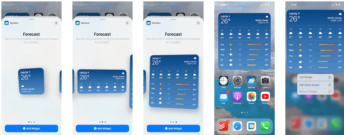
Fig. 2. Using WidgetKit to display dynamic content in the Weather app

Thanks to integration with SwiftUI, developers can create convenient, context-sensitive elements that increase user engagement [3].