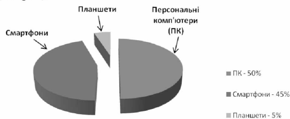
Діагр. 2. Використання студентами пристроїв для перегляду електронних ресурсів

лічильників Google Analytics, які свідчать, що для перегляду електронних ресурсів сучасні користувачі майже однаково послуговуються і ПК, і смартфонами (діагр. 2).