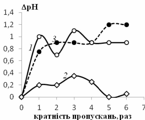
Рис. 2. Вплив магнітного поля на рН дистильованої (1), деіонізованої високоомної води (2) та водопровідної води (3); T = (14 \pm 2)^\circ C

Встановлено, що в результаті дії магнітного поля рН для всіх досліджених вод зміщується в лужну сторону. При чому зміна рН для деіонізованої води незначна (рис.2, крива 2).