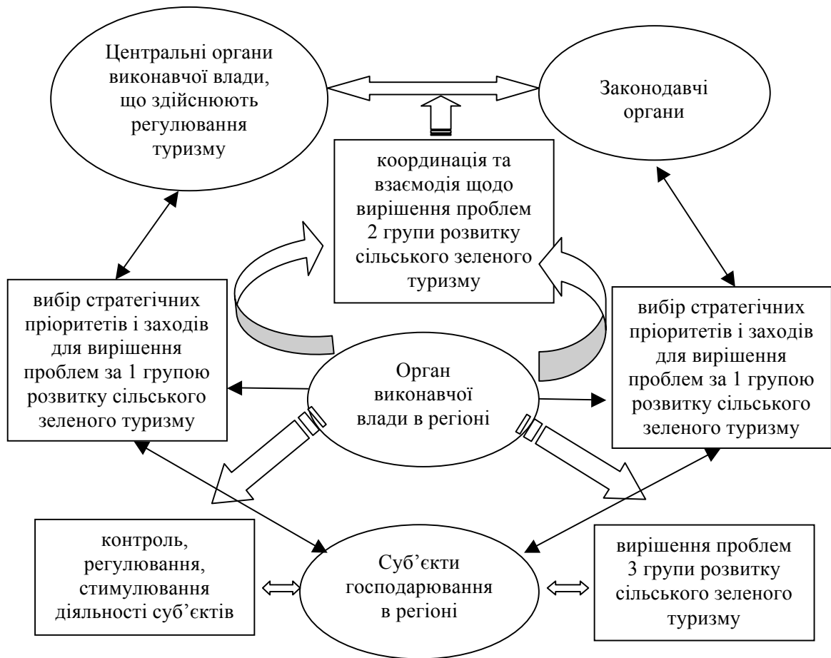
Рис. 1 Взаємодії регіональних органів виконавчої влади щодо стратегічного розвитку сільського зеленого туризму

сільського зеленого туризму на основі вирішення проблем за кожною з трьох груп, зображено на рис. 1.