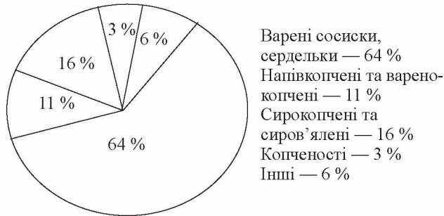
Рис. 2. Структура ринку м'ясних виробів за видами продукції у 2013 р., побудовано автором за [8]

лежить від сировинної бази, а їх збут обмежений місцем виробництва та прилеглими районами. Структура ринку ковбасних виробів відображена на рис. 2.