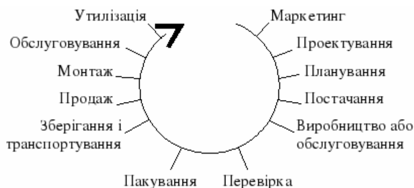
Рис. 1.1. «Петля якості»

відповідно до призначення, то можна говорити про «петлю якості». Петля якості – це концептуальна модель взаємозалежних видів діяльності, що впливають на якість на різних стадіях від визначення потреб до оцінювання ступеня їх задоволення; являє собою модель впливу системи якості на процес створення продукції або надання послуг шляхом послідовної реалізації функцій адміністративного та оперативного управління підприємством. Основні етапи якості зображені на рис. 1.1.