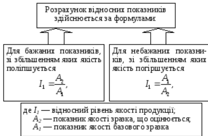
Рис. 1.3. Диференційний метод оцінки якості продукції

одночасному використанні одиничних і комплексних показників, коли частина одиничних показників об'єднується у групи, а для кожної групи розраховується відповідний комплексний показник. Далі на основі отриманої сукупності комплексних і одиничних показників можна оцінити рівень якості диференційним методом.