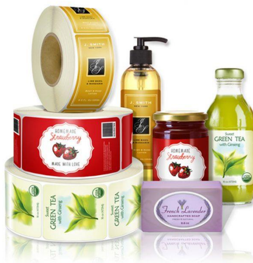
Рис. 3.1. Самоклеючі етикетки

Компанія стежить за тенденціями застосування етикеток у виробництві кожної окремо взятої галузі, що дає можливість розробляти продукцію з урахуванням сучасних вимог ринку.