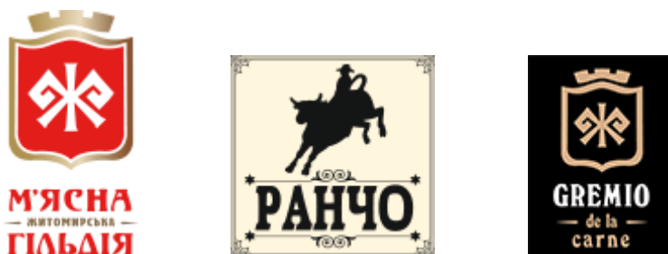
Рис. 2.1. Логотипи підприємства

Основним брендом ТОВ «Житомирський м'ясокомбінат» залишається ТМ «М'ясна Гільдія», оскільки з неї і починався весь цикл виробництва. Торгова марка представляє всі види ковбасної продукції: сосиски, сардельки, варені ковбаси, напівкопчені та сирокоччені ковбаси, а також м'ясні делікатеси.