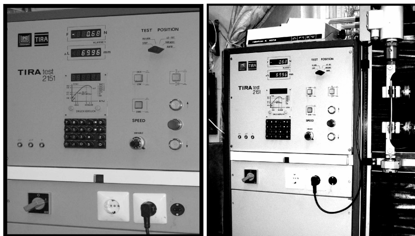
Рис. 1. Випробувальна машина TIRAtest-2151 та її пульт керування (праворуч)

Фізико-механічні властивості досліджувалися на універсальній випробувальній машині TIRAtest-2151 (рис. 1) відповідно до ГОСТ 14359-69 [9] та ГОСТ 14236-81 [10].