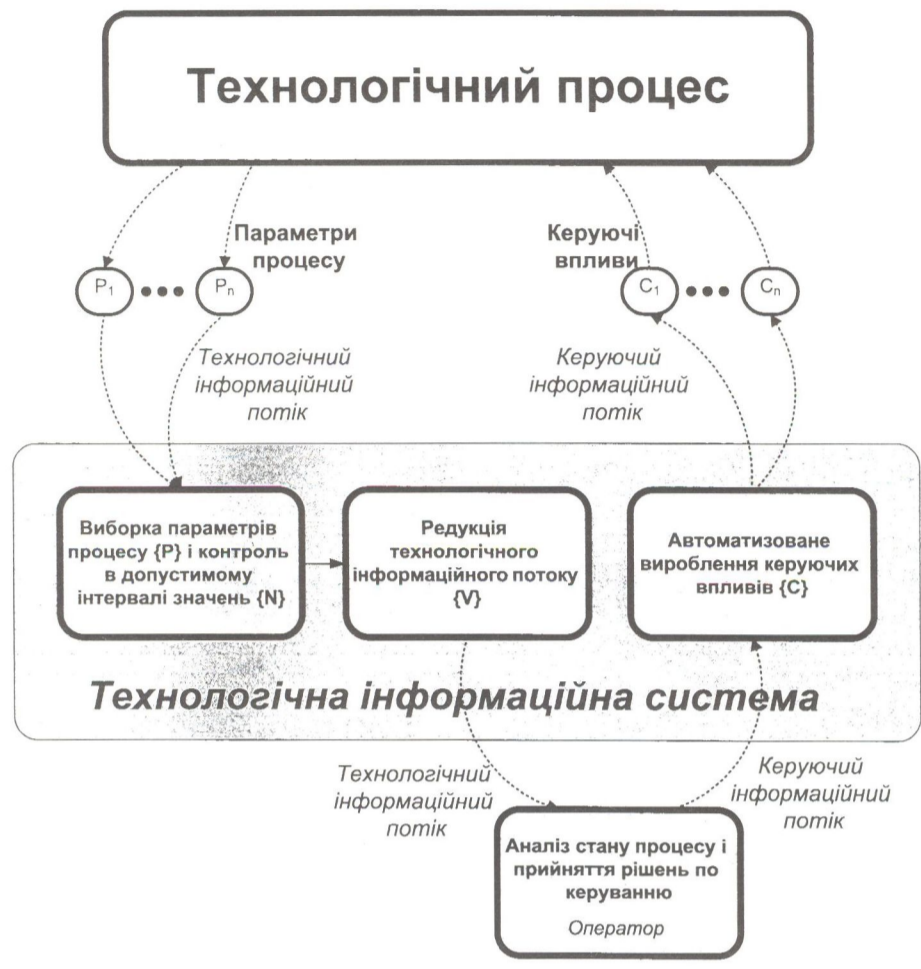
Рис. 1. Типова задача автоматизованого керування технологічним процесом

При роботі дифузійної установки необхідно підтримувати оптимальне значення якісних показників, зокрема концентрацію сухих речовин в дифузійному соці і кількість цукру в жомі. Безпосереднє управління цими параметрами неможливе, тому виникає необхідність їх регулювання шляхом зміни непрямих параметрів. До останніх відносяться показники матеріального балансу, теплового режиму, навантаження апаратів. Відповідно ПДА як об'єкт управління є складною нелінійною, стохастичною системою з розподіленими параметрами, частина з яких не має кількісного однозначного вимірювання.