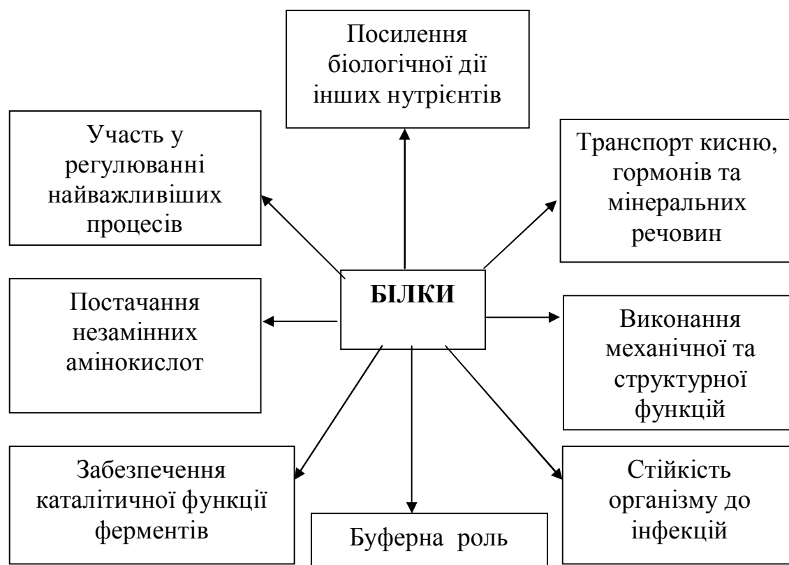
Рис. 1. Основні функції білків в організмі людини

Найважливішим компонентом їжі є білки, оскільки саме ця група макронутрієнтів забезпечує ріст, утворення нових і відновлення ушкоджених тканин. Всі ферменти та деякі гормони, наприклад інсулін, є білками. Білки – потенційні джерела енергії: при окисненні 1 грама білку вивільняється 4,1 ккал. Зараз в усьому світі білки називають протеїнами (від грецького слова protos – перший, важливіший). Цим терміном підкреслюється надзвичайно важлива роль білків у життєдіяльності організмів [1], що ілюструється схемою (рис. 1).