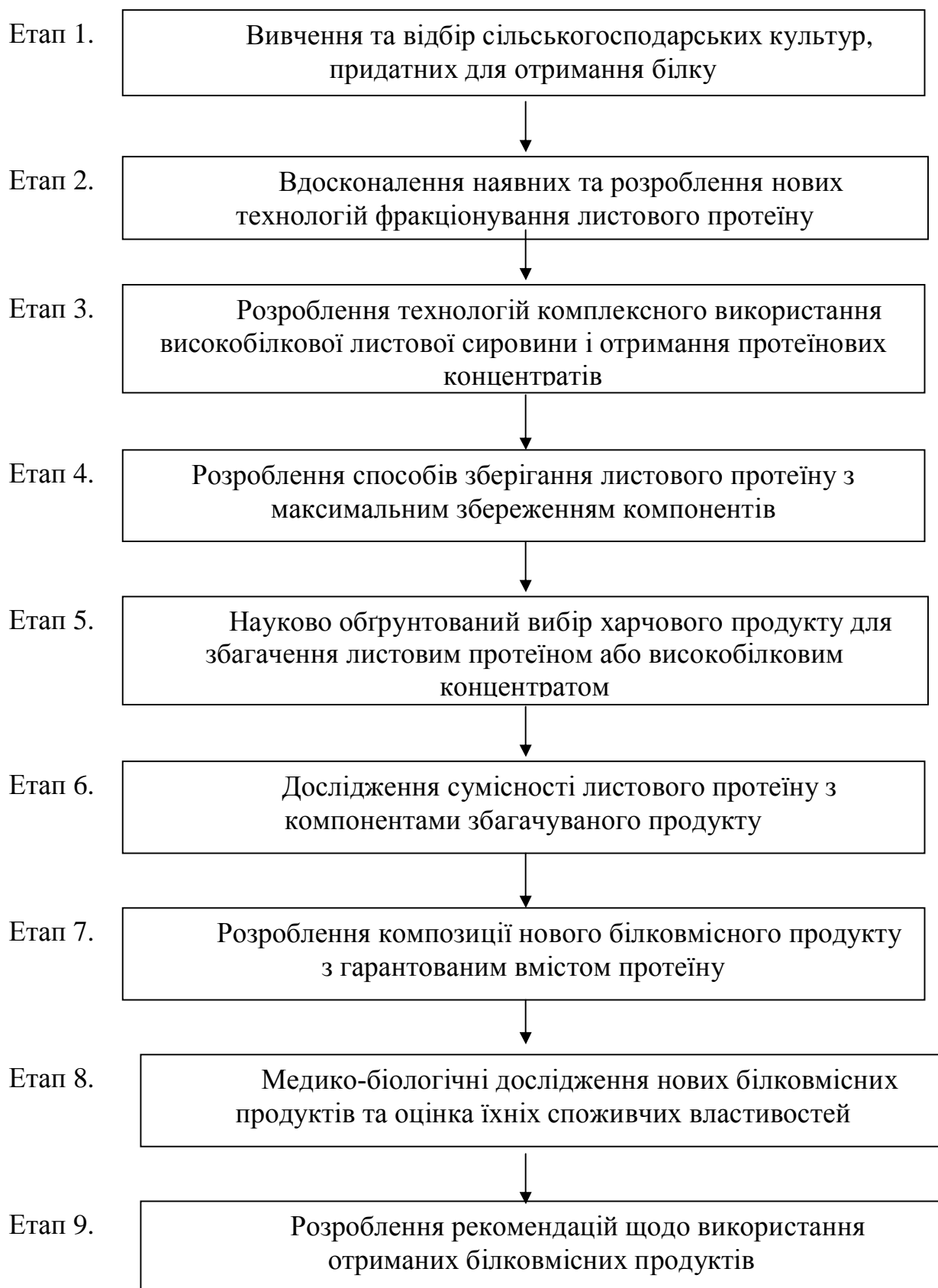
Рис. 2. Етапи отримання білкових концентратів із зеленої маси рослин